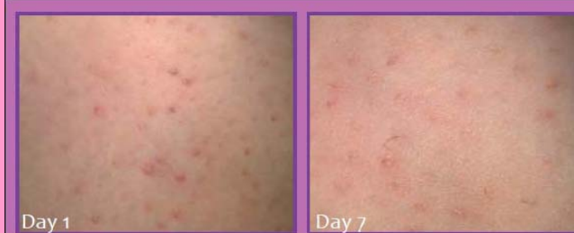
KERATOCLEAN® HYDRA PB all'1%