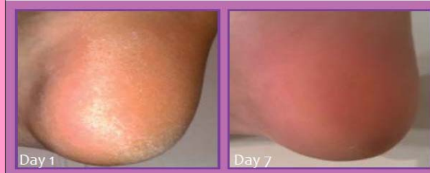
KERATOCLEAN® HYDRA PB all'1%