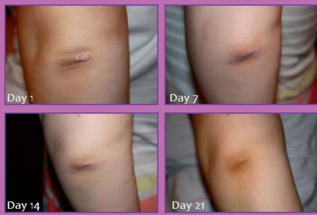
KERATOCLEAN® HYDRA PB all'1%